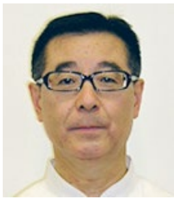
早瀬治 国際教練 Hayase Osamu